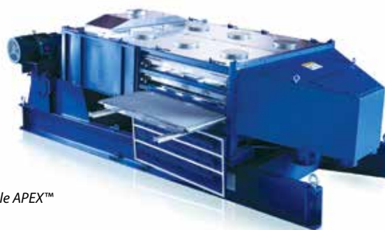
▲ Crible APEX™