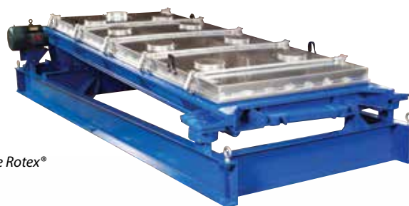
▲ Crible Rotex®