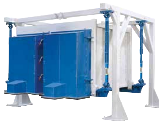
▲ Minerals Separator™